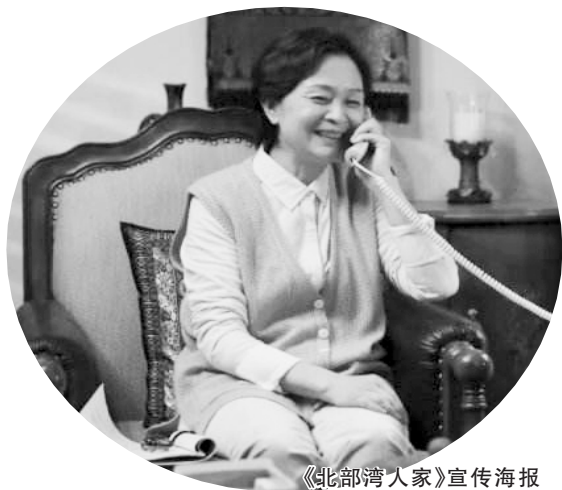
《北部湾人家》宣传海报