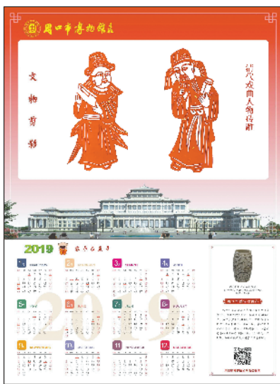
文物剪纸挂历图样