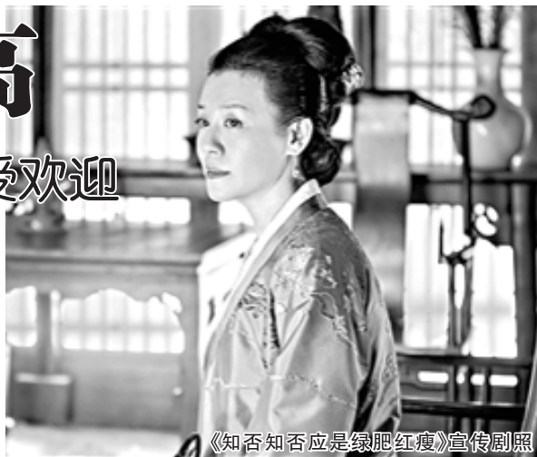
《知否知否应是绿肥红瘦》宣传剧照

雷东宝母亲的形象非常经典，她丈夫早逝，独自把雷东宝拉扯长大，个中艰辛自不必多言，看着儿子