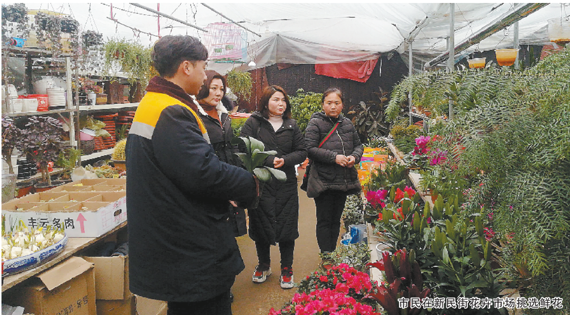
市民在新民街花卉市场挑选鲜花

“新民街、汉阳路、交通大道东段的花卉市场主要以零售为主，而位于商水县S213附近的豫东花卉大世界则以批发为主，是目前我市规模最大的综合性花卉市场，有商户近40家，经营有高中低档盆景和各类鲜花。”周口市花卉协会常务副会长雷平喜介绍，由于各大花卉基地的产量较往年有所增加，货源充足，目前鲜花的价格较往年下降10%。