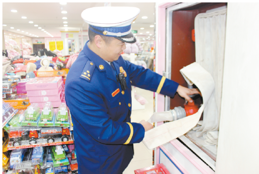
消防员检查室内消火栓