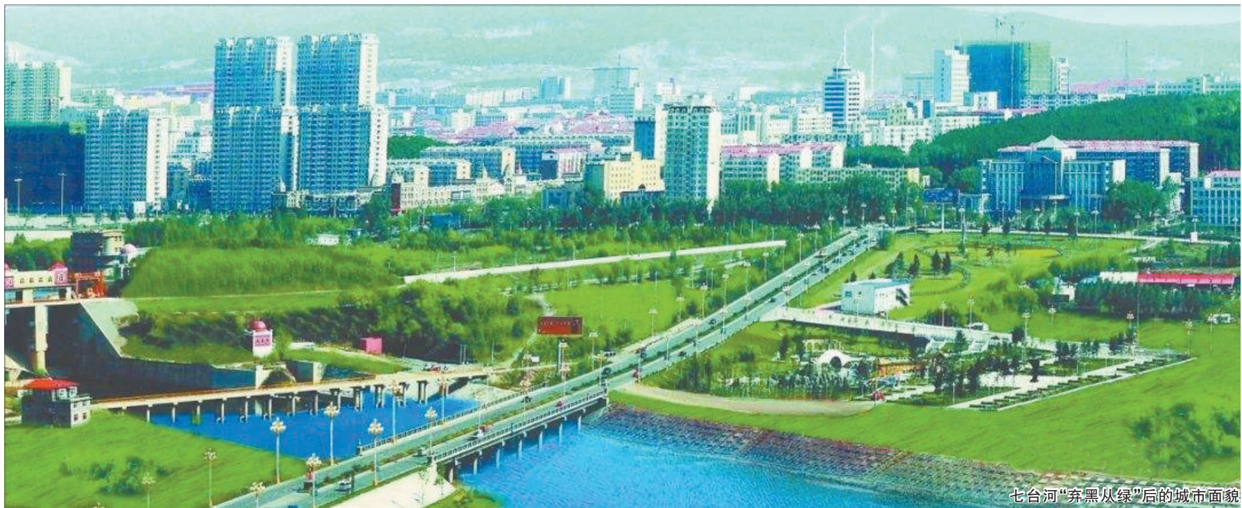
七台河“弃黑从绿”后的城市面貌