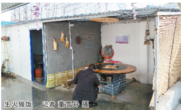
生火做饭