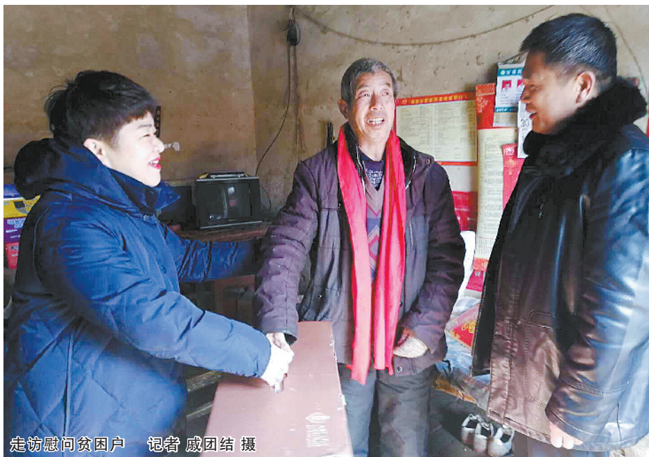
走访慰问贫困户