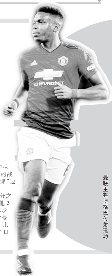
曼联主将博格巴传射建功

曼联将在足总杯四分之一决赛中迎战狼队,其他3场对阵形势如下:米尔沃尔对布莱顿;斯旺西对曼城;沃特福德对水晶宫。比赛将于3月15日至17日进行。