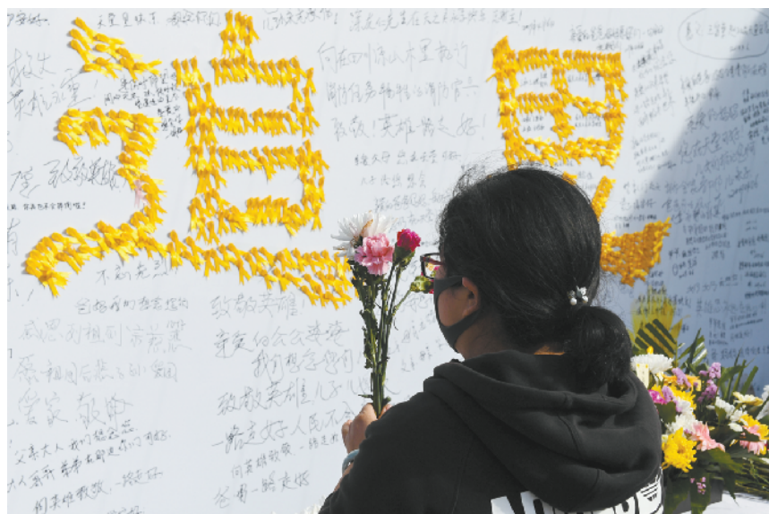
4月6日，市民在呼和浩特市满都海公园的鲜花公共祭祀点祭奠逝者。