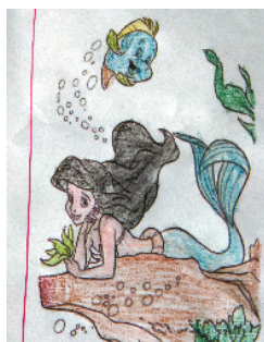
小记者：冯涵洲 编号：191969 周口李庄小学三（3）班