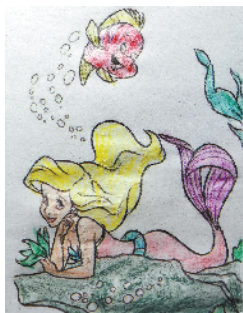
小记者：张哲 编号：192729 周口闫庄小学四（1）班