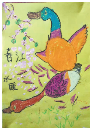
春江暖鸭先知 小记者：李昀钊 编号：193049 周口六一路小学一（3）班

本栏目刊发小记者的书法、绘画、摄影等作品。小记者们如果有这些爱好，快快拿起手中的笔开始创作吧！作品创作完成后，请用相机拍下来发送到 zkwbxjz@126.com