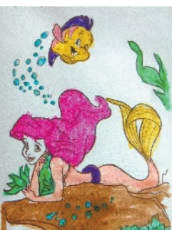
小记者：张议匀 编号：190987 周口七一路一小一（3）班