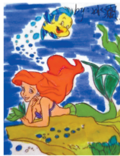
小记者：王悠然 编号：193135 周口六一路小学五（4）班