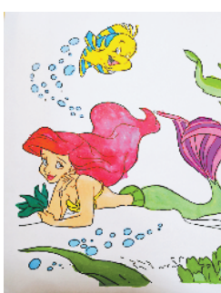
小记者：方怡帆 编号：191166 周口七一路一小三（1）班