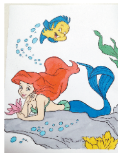
小记者：刘雨汐 编号：191590 周口开发区实验学校一（3）班