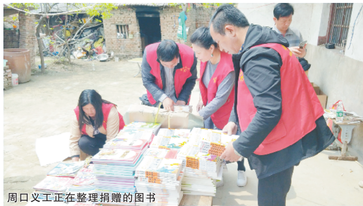
周口义工正在整理捐赠的图书

少图书。回家后,姐妹俩便把这些书擦拭干净,有的书或画册的封面脱落了,她们就为这些书包上一层牛皮纸当封面。然后,把这些书井井有条地摆放在家里一张桌子上,供村里的小伙伴们免费借阅。就这样,经过姐妹俩的坚持和努力,2016年,她们的图书馆建成了。近日,姐妹俩的故事经中央、省、市媒体关注后,她们得到了社会各界的关爱。