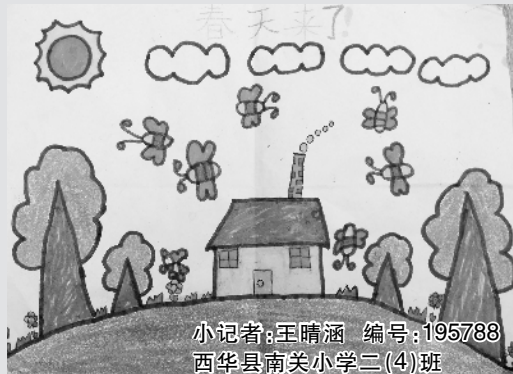
小记者:王晴涵 编号:195788 西华县南关小学二(4)班