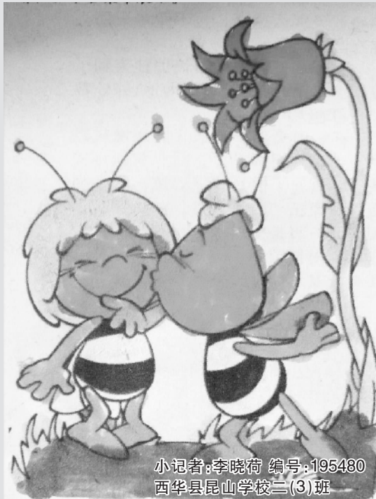
小记者:李晓荷 编号:195480 西华县昆山学校二(3)班