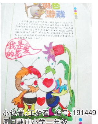
小记者:王梦翟 编号:191449 周口韩庄小学一年级