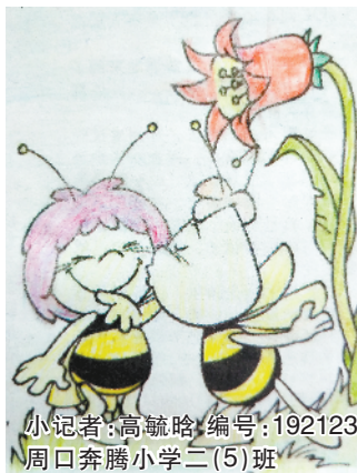
小记者:高毓略 编号:192123 周口奔腾小学二(5)班