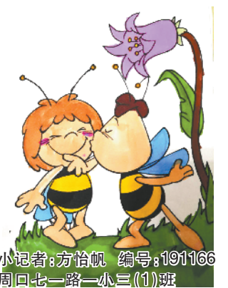
小记者:方怡帆 编号:191166 周口七一路一小三(1)班