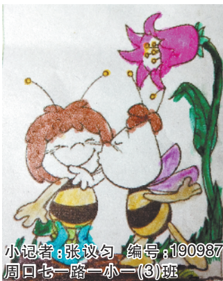
小记者:张议匀 编号:190987 周口七一路一小一(3)班