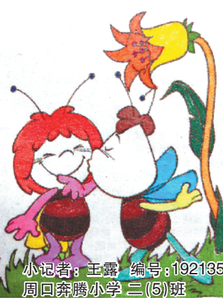
小记者:王露 编号:192135 周口奔腾小学二(5)班