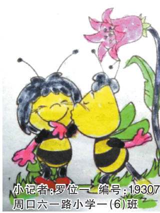
小记者:罗位一 编号:193076 周口六一路小学一(6)班