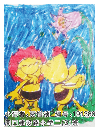
小记者:贾镒祺 编号:191386 周口建设路小学二(3)班