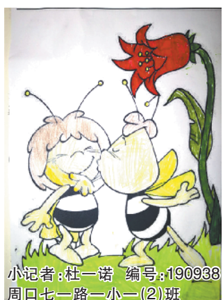
小记者:杜一诺 编号:190938 周口七一路一小一(2)班