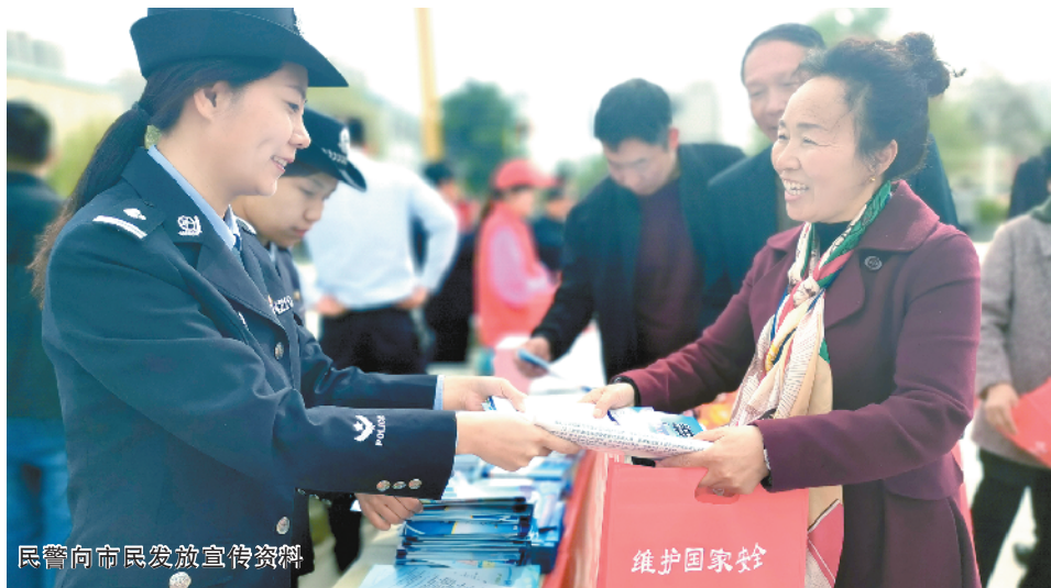
民警向市民发放宣传资料