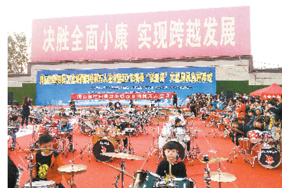
中原九拍第二届百人打鼓音乐节嗨翻全场