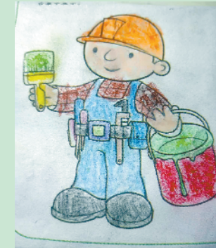
小记者:秦纳若 编号:190269 周口新民小学二(2)班