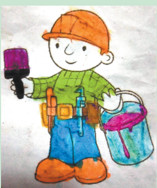
小记者:张议匀 编号:190987 周口七一路一小一(3)班