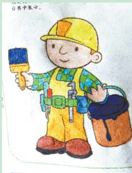
小记者:余畅想 编号:197368 项城市工业路小学三(4)班