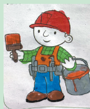
小记者:刘雨汐 编号:191590 周口经济开发区实验学校一(3)班