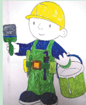
小记者:张开伦 编号:190007 周口七一路一小一(2)班