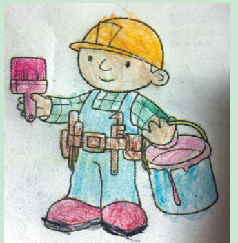
小记者:张博睿 编号:191167 周口七一路一小三(5)班