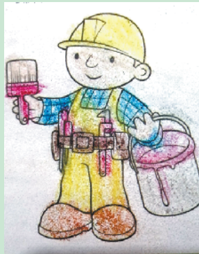
小记者:赵越泽 编号:192998 周口实验小学二(4)班