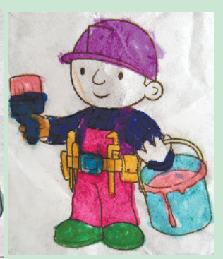
小记者:单伊婷 编号:191888 周口李庄小学二(1)班