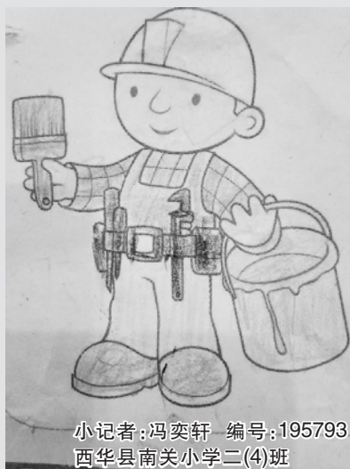
小记者:冯奕轩 编号:195793 西华县南关小学二(4)班