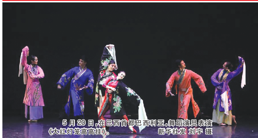
5月20日,在巴西首都巴西利亚,舞蹈演员表演《大红灯笼高高挂》。

新华社里约热内卢5月25日电(记者 赵焱 陈威华)金碧辉煌的里约热内卢市立剧院25日晚座无虚席,中国中央芭蕾舞团(中芭)带来的融合了京剧等传统元素的芭蕾舞剧《大红灯笼高高挂》在这里上演,赢得巴西观众的热烈掌声。