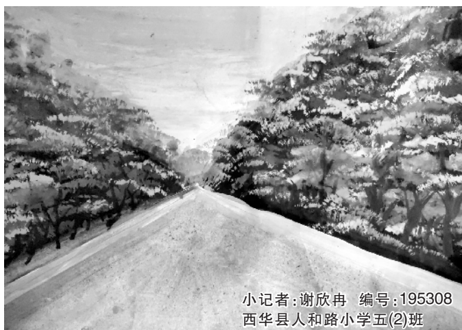
小记者:谢欣冉 编号:195308 西华县人和路小学五(2)班