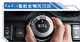
两种模式自由切换,实现全路况的驱动适应性。