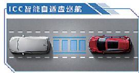
实现自动跟车,解放双手,舒缓长途驾驶的疲劳感。