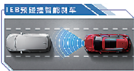
实时监测碰撞风险,及时报警,必要时自动刹车,提供极及时的保护。