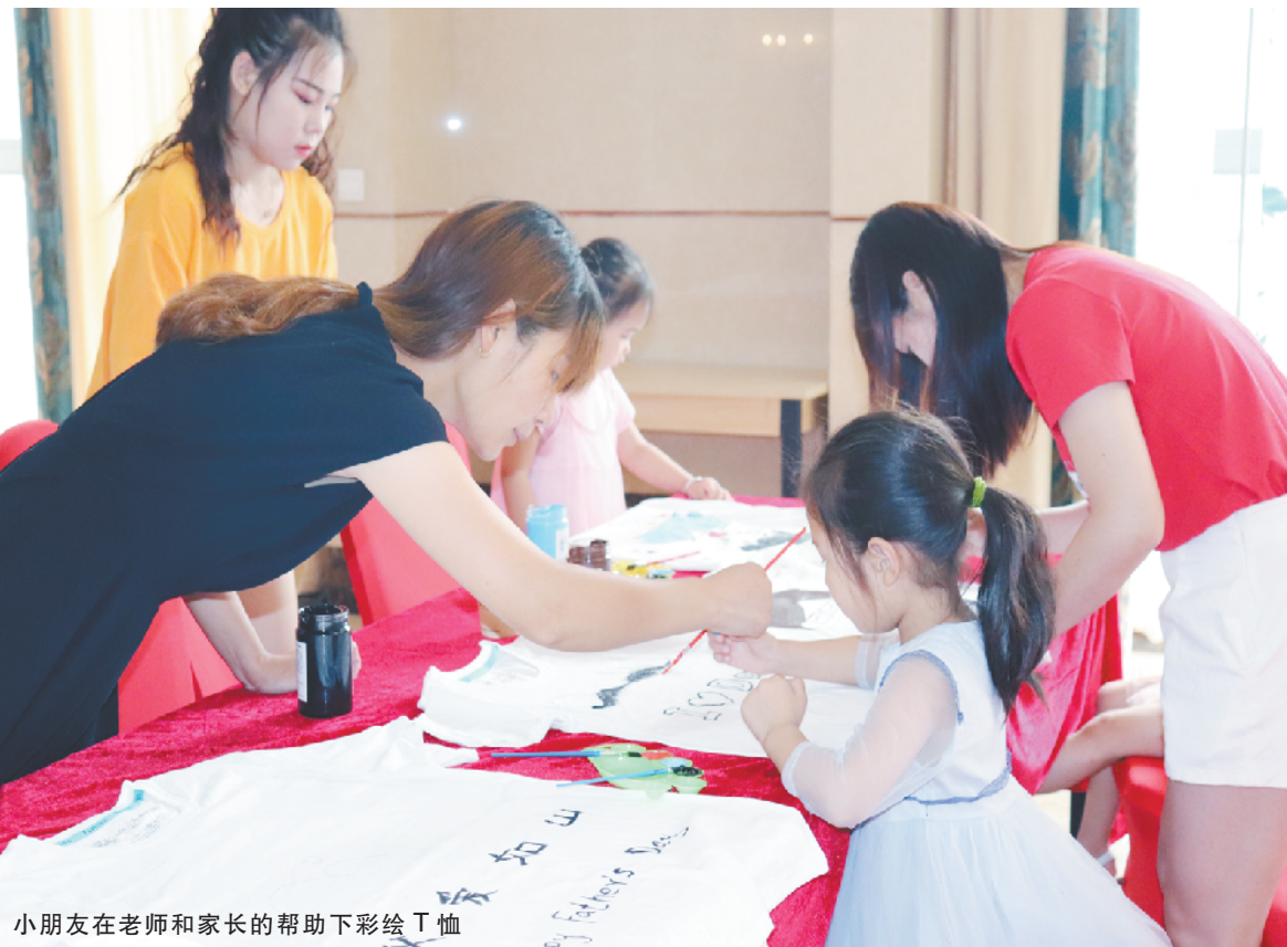
小朋友在老师和家长的帮助下彩绘T恤

据悉，汇林绿洲二期风华15号楼、16号楼载誉加推，建筑面积约85平方米~166平方米的实景准现房正在热销中。首付2万元起，即可抢购准现房，现在买，明年5月可入住，近期有置业计划的市民，不妨到汇林绿洲营销中心了解详情。