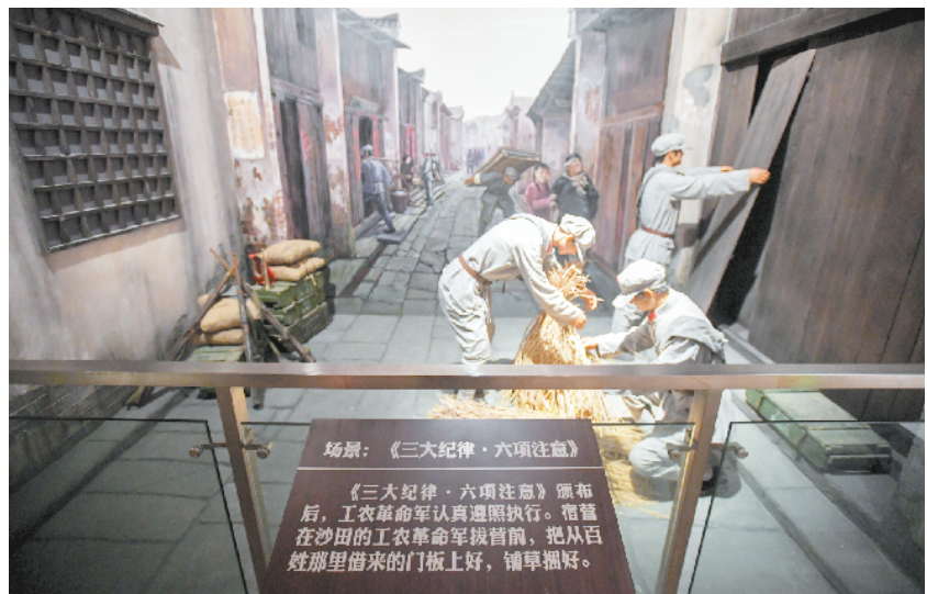
湖南郴州市桂东县沙田镇纪律文化中心展出的《三大纪律·六项注意》场景