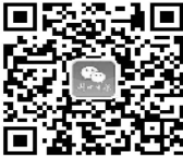
周口日报微信公众号

备注: 1.请在您支持的候选人后打“√”,每张选票只准选 10 人,多选或少选无效。 2.选票邮寄地址:周口市教育体育局 4 楼师训科“周口最美教师”评选活动组委会办公室收。 3.微信投票请关注:周口日报微信公众号、周口晚报微信公众号。 4.选票复印无效;截止日期:2019 年 7 月 17 日。