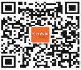
周口晚报微信公众号