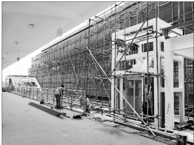
淮阳南站站房外部正在装修