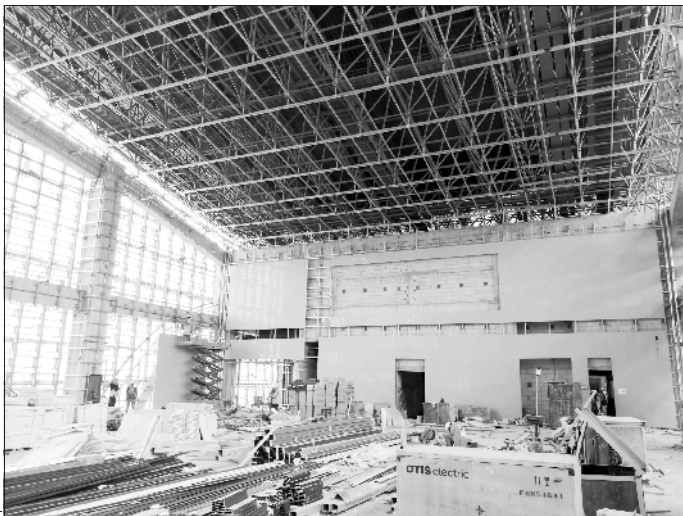
西华站站房内部装修现场