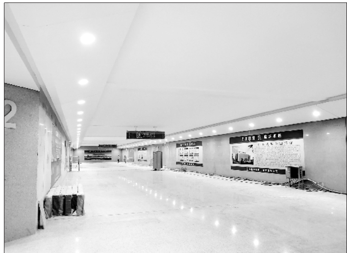
周口东站旅客通道已完工

据市铁办相关负责人介绍,截至目前,郑合高铁路基工程、铺轨工程、站台雨棚、站房主体工程已全部完工,马上要进入联调联试阶段。