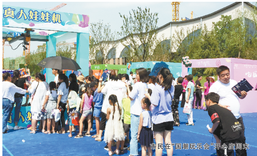
市民在“国潮玩乐会”开心度周末