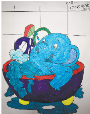
小记者：张开伦 编号：190007 周口七一路一小二(2)班