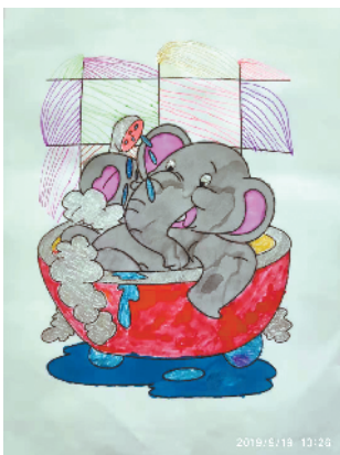
小记者：苗馨心 编号：193050 周口六一路小学二(2)班