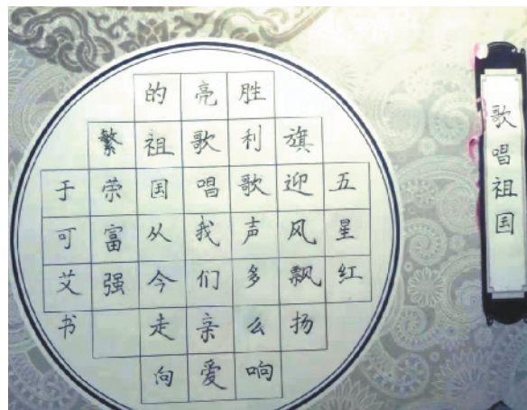
小记者：于可艾 编号：190959 周口七一路一小二(2)班

本栏目刊发小记者的书法、绘画、摄影等作品。小记者们如果有这些爱好，快快拿起手中的笔开始创作吧！作品创作完成后，请用相机拍下来发送到 zkwbxjz@126.com