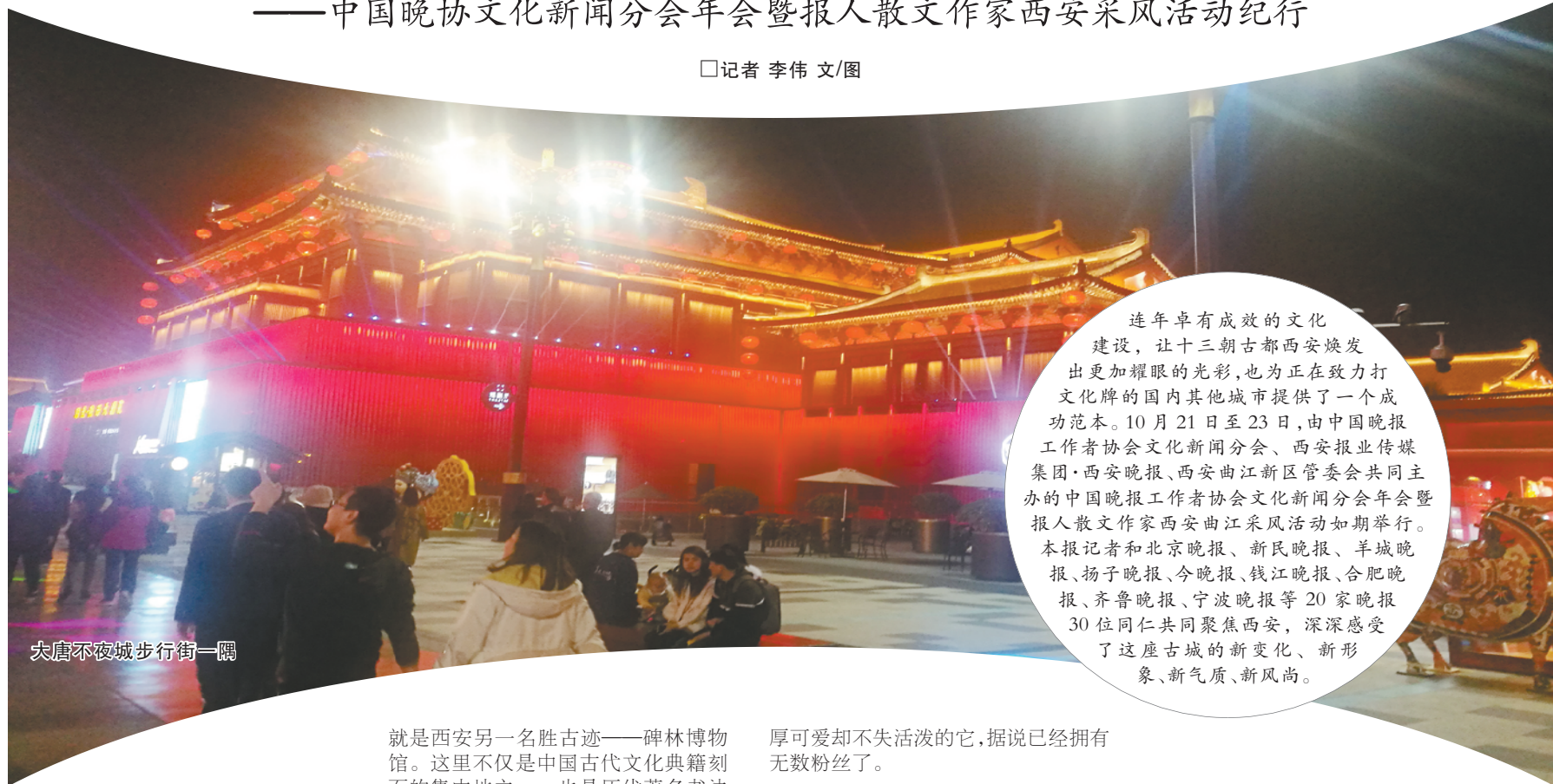
大唐不夜城步行街一隅

连年卓有成效的文化建设，让十三朝古都西安焕发出更加耀眼的光彩，也为正在致力打文化牌的国内其他城市提供了一个成功范本。10月21日至23日，由中国晚报工作者协会文化新闻分会、西安报业传媒集团·西安晚报、西安曲江新区管委会共同主办的中国晚报工作者协会文化新闻分会年会暨报人散文作家西安曲江采风活动如期举行。本报记者和北京晚报、新民晚报、羊城晚报、扬子晚报、今晚报、钱江晚报、合肥晚报、齐鲁晚报、宁波晚报等20家晚报30位同仁共同聚焦西安，深深感受了这座古城的新变化、新形象、新气质、新风貌。