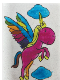
小记者:王佑麟 编号:192563 周口闫庄小学 二(6)班