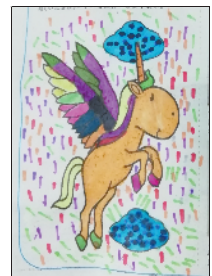
小记者:普沛琪 编号:191698 周口五一路小学 二(4)班