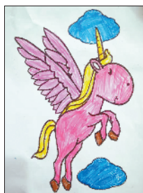
小记者:苑妙茜 编号:191837 周口李庄小学二 (1)班