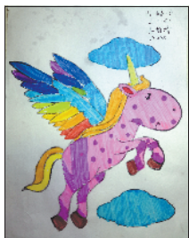
小记者:齐柏清 编号:191235 周口七一路一小 二(4)班