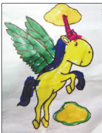
小记者:李睿洋 编号:191871 周口李庄小学 二(4)班