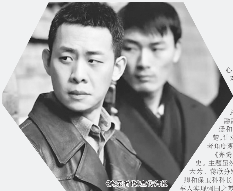
《光荣时代》宣传海报