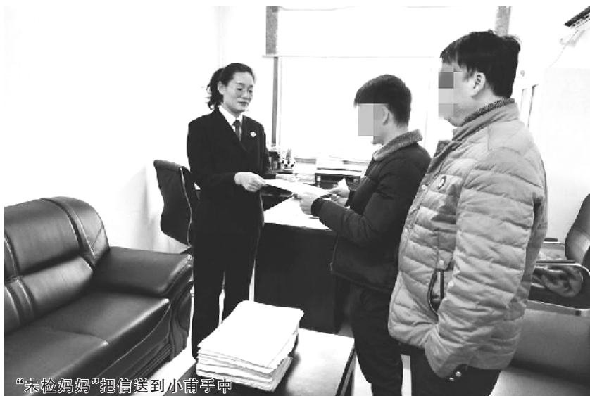
“未检妈妈”把信送到小甫手中