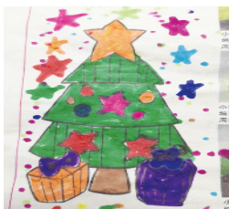
小记者：苑静柔 编号：191880 周口李庄小学二(4)班