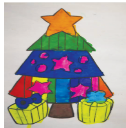
小记者：王涵 编号：191861 周口李庄小学二(3)班