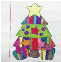
小记者：李易清 编号：191852 周口李庄小学二(2)班