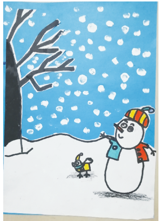
《雪人》 小记者：普沛琪 编号：191698 周口五一路小学二(4)班