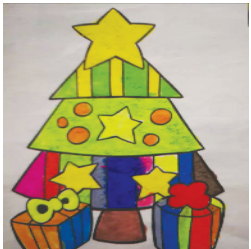
小记者：段博涵 编号：191857 周口李庄小学二(3)班