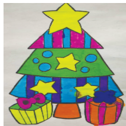
小记者：宋悦 编号：191859 周口李庄小学二(3)班