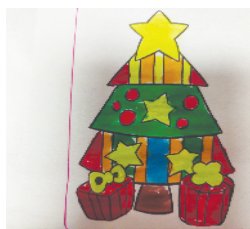
小记者：王佑麟 编号：192563 周口闫庄小学二(6)班