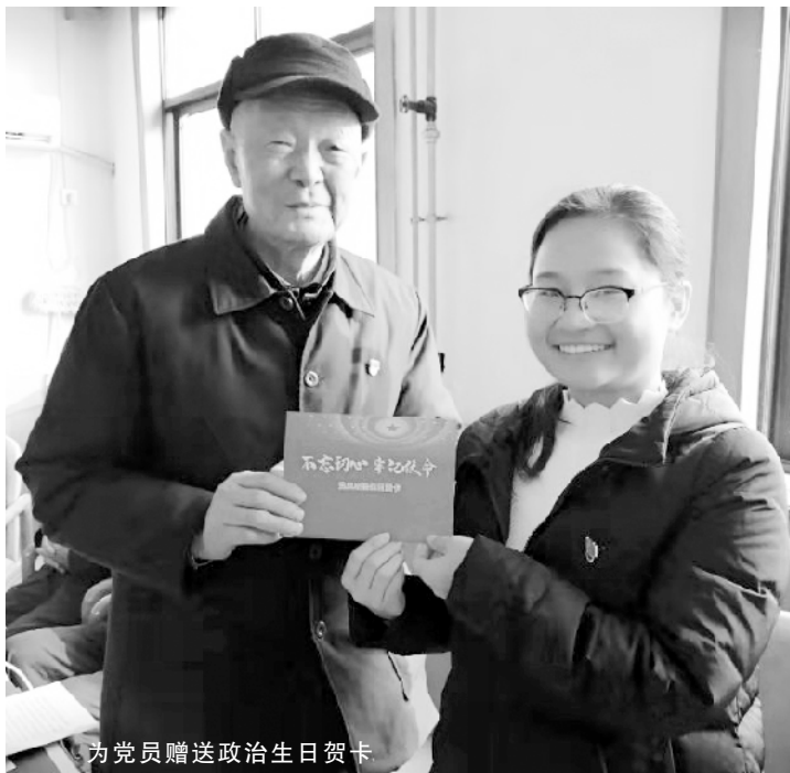
为党员赠送政治生日贺卡

他们用朴实的话语,再一次诠释了党员的初心和使命,引发大家的共鸣,现场掌声阵阵,大家最后还共同唱起了《生日快乐歌》。