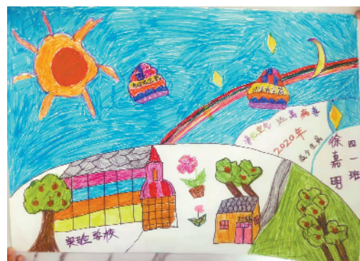
小记者:徐嘉明 编号:191659 周口经济开发区实验学校四(1)班