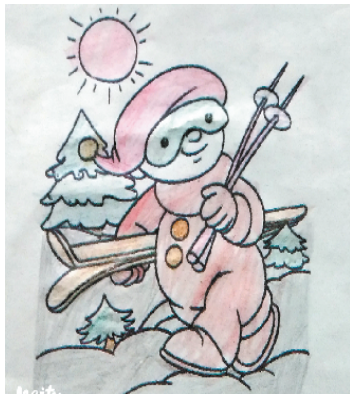
小记者:夏安然 编号:191906 周口李庄小学三(3)班