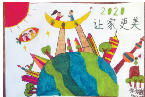
小记者:张海巍 编号:191627 周口经济开发区实验学校四(1)班

本栏目刊发小记者的书法、绘画、摄影等作品。小记者们如果有这些爱好,快快拿起手中的笔开始创作吧!作品创作完成后,请用相机拍下来发送到 zkwbxjz@126.com