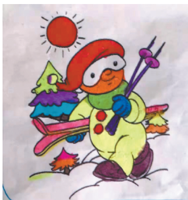
小记者:李易清 编号:191852 周口李庄小学二(2)班