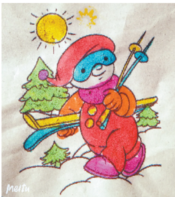
小记者:杨若鑫 编号:191927 周口李庄小学三(3)班