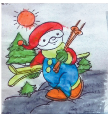
小记者:赵越泽 编号:192998 周口实验小学三(6)班