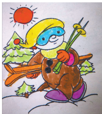
小记者:姚子洋 编号:191868 周口李庄小学二(3)班