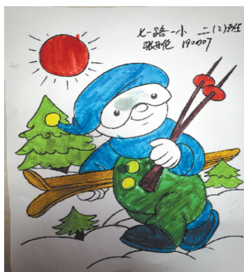
小记者:张开伦 编号:190007 周口七一路一小二(2)班