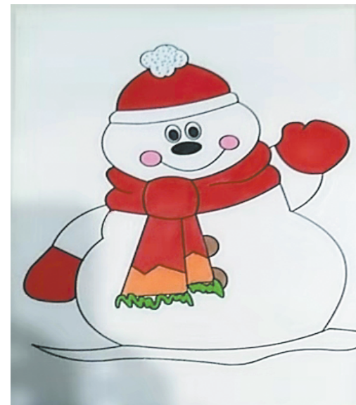
小记者:王乐 编号:192745 周口闫庄小学五(1)班