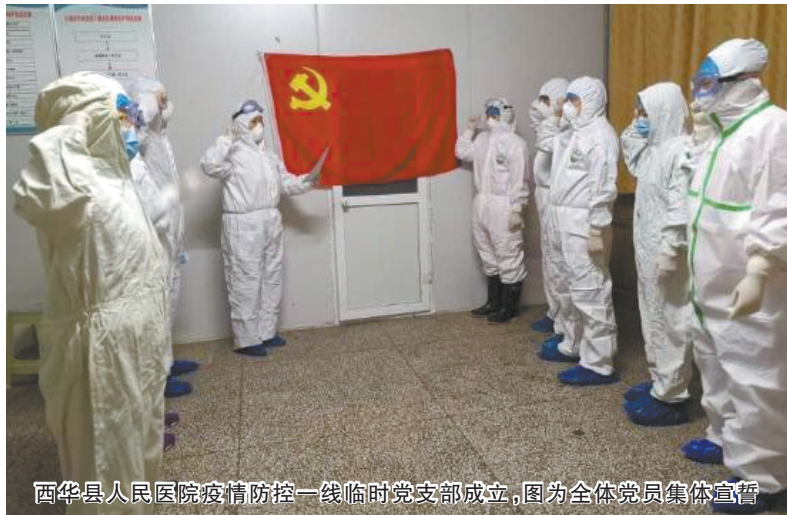
西华县人民医院疫情防控一线临时党支部成立,图为全体党员集体宣誓