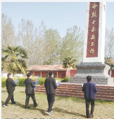
西华县党员干部祭奠英烈