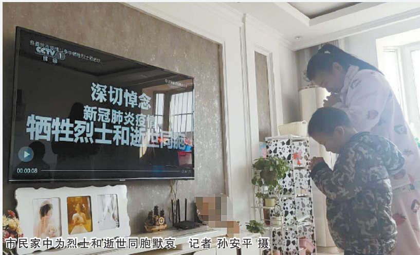
市民家中为烈士和逝世同胞默哀