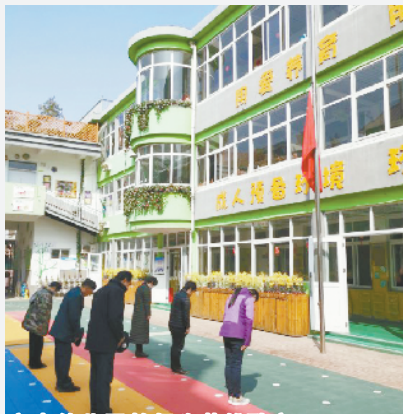
市直幼儿园教师为英雄默哀