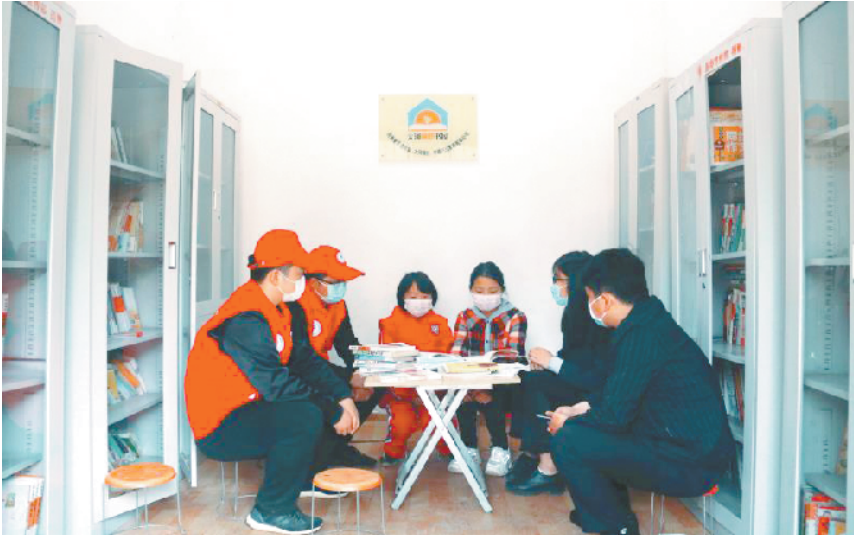
团市委工作人员和志愿者与小姐妹交谈