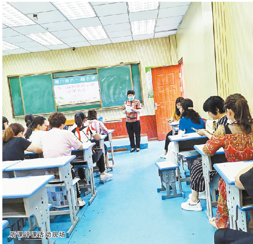
听课评课活动现场