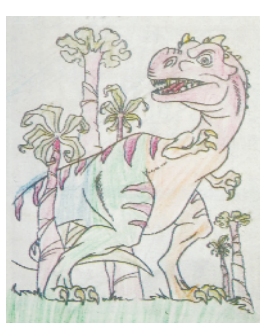
小记者:田煜琪 编号:201910 周口李庄小学二(1)班