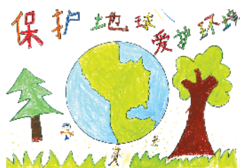
小记者:高博瀚 编号:201249 周口八一路二小二(4)班 (辅导老师:杨晓凤)