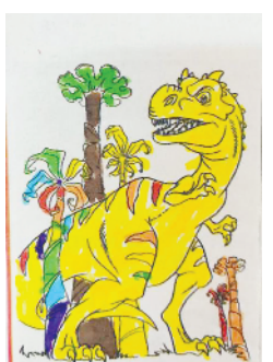
小记者:高语琦 编号:201925 周口李庄小学二(2)班