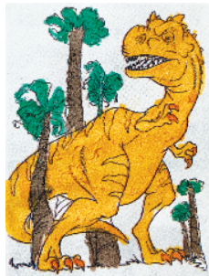
小记者:肖雨东 编号:201230 周口八一路二小一(1)班