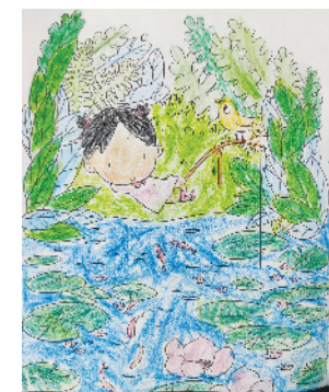
小记者:王若雨 编号:200499 周口闫庄小学一(1)班 (辅导老师:周新梅)