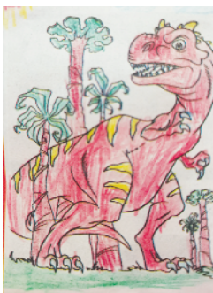
小记者:李芮琪 编号:201875 周口李庄小学一(1)班