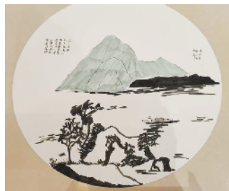
小记者:严冰哲 编号:200302 周口奔腾小学五(3)班