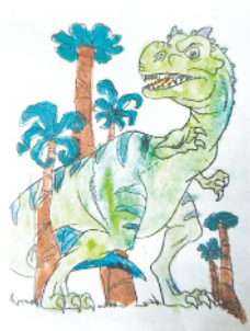
小记者:栾一帆 编号:201877 周口李庄小学一(1)班