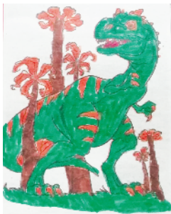
小记者:普沛琪 编号:200117 周口五一路小学二(4)班