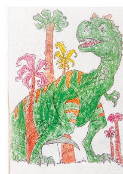
小记者:苏妙然 编号:201880 周口李庄小学一(1)班