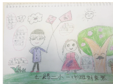
小记者:刘奕然 编号:201050 周口七一路二小一(4)班

本栏目刊发小记者的书法、绘画、摄影等作品。小记者们如果有这些爱好,快快行动起来吧!作品完成后,请用相机拍下并来发送到 zkwbxjz@126.com。