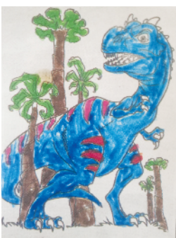
小记者:苑如萱 编号:201907 周口李庄小学一(4)班