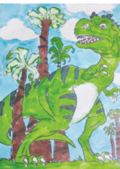
小记者:顾雨佳 编号:200379 周口新民小学五(1)班