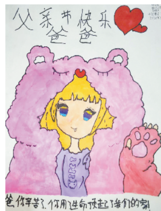
小记者:李涵珂 编号:205047 西华县南关小学四(3)班