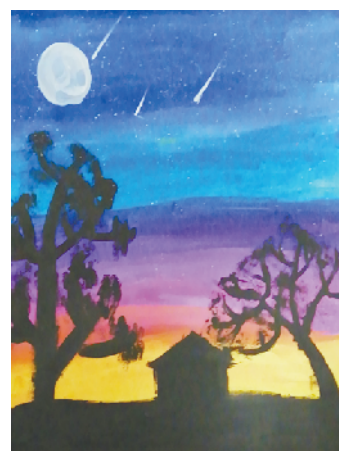
小记者:赛佳灿 编号:208052 沈丘县西关小学四(3)班