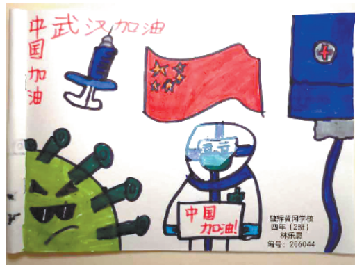
小记者:林乐晨 编号:205044 融辉黄冈学校四(2)班