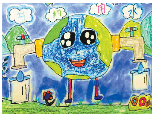
小记者:杨程铭 编号:208056 沈丘县西关小学一(1)班