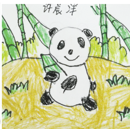
小记者:许晨洋 编号:205102 西华县实验小学二(4)班