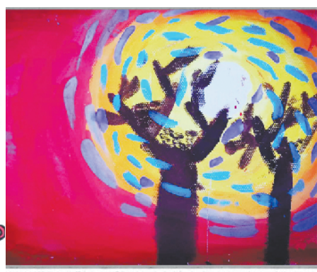
小记者:黄冠铭 编号:208033 沈丘县西关小学五(2)班