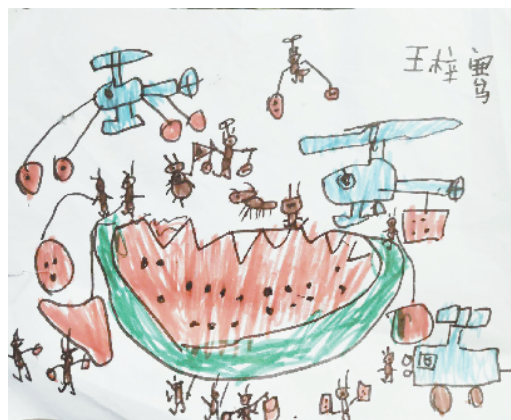
小记者:王梓豪 编号:205016 西华县人和路小学一(4)班