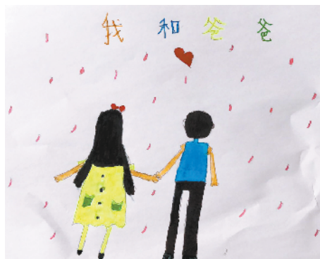
小记者:王畅畅 编号:205082 西华县昆山学校二(2)班