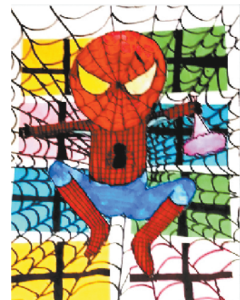
小记者:马天泽 编号:208029 沈丘县西关小学三(3)班