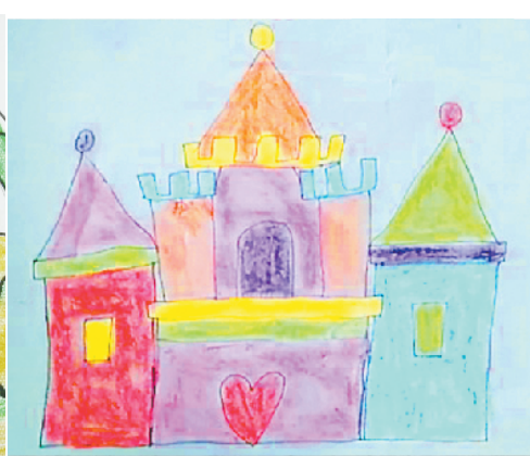
小记者:武锦毅 编号:208071 沈丘县西关小学三(3)班