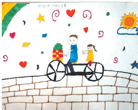
小记者:王涵蕾 编号:205051 西华县实验小学二(5)班