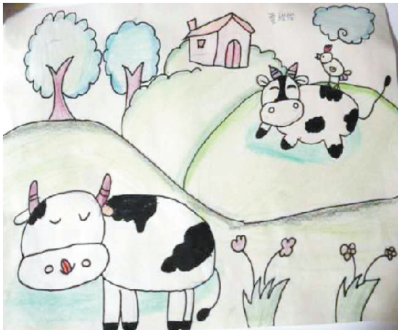
小记者:贾欣怡 编号:205116 西华县西关小学三(3)班