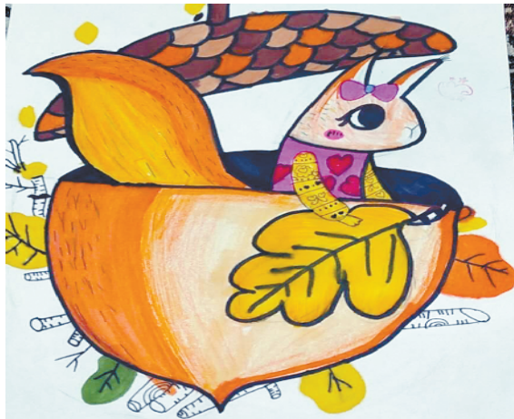
小记者:方晓宇 编号:205083 西华县昆山学校三(1)班