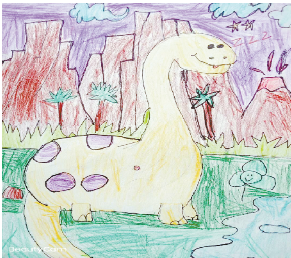
小记者:刘坤畅 编号:206099 商水新城小学二(3)班