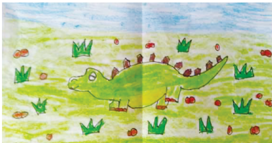
小记者:马艺培 编号:206148 商水县新城小学二(1)班