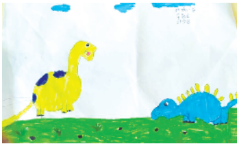
小记者:李统关 编号:206149 商水县新城小学二(1)班