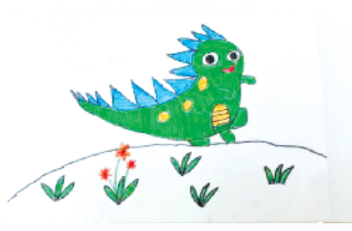
小记者:张梓晓 编号:206106 商水县新城小学二(3)班