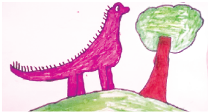
小记者:柴俊宇 编号:206112 商水县新城小学二(3)班