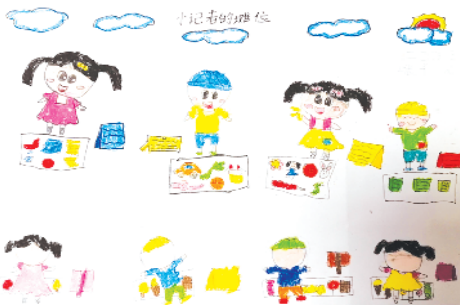
小记者:张子悦 编号:206138 商水县新城小学二(4)班