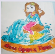
小记者:何同渡 编号:202732 周口六一路小学一(9)班