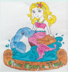
小记者:祁梓淇 编号:200592 周口闫庄小学一(5)班