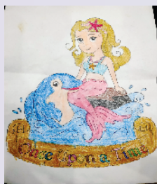
小记者:马于雅 编号:201063 周口七一路二小一(4)班