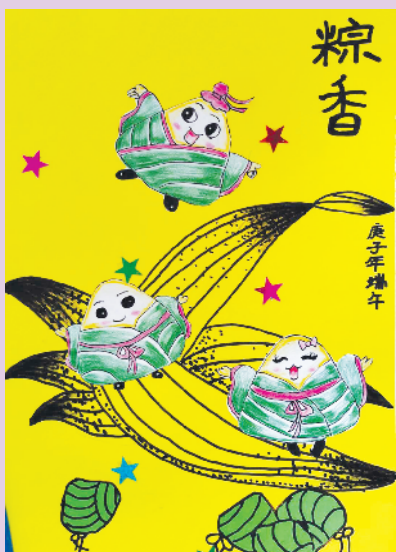
小记者:李兆宇 编号:202728 周口六一路小学一(9)班(辅导老师:李琨)

本栏目刊发小记者的书法、绘画、摄影等作品。小记者们如果有这些爱好,快快行动起来吧!作品完成后,请用相机拍下并发送到zkwbxjz@126.com。