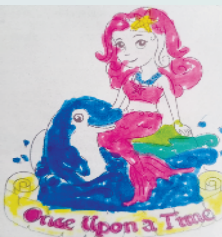
小记者:袁凡 编号:200522 周口闫庄小学一(2)班