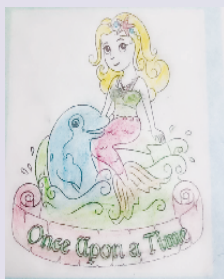
小记者:韩雨辰 编号:201900 周口李庄小学一二(2)班