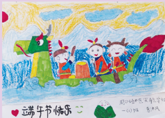
小记者:劳沐风 编号:201708 周口经济开发区实验学校一(1)班