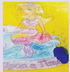
小记者:刘乾鸽 编号:200627 周口闫庄小学二(2)班