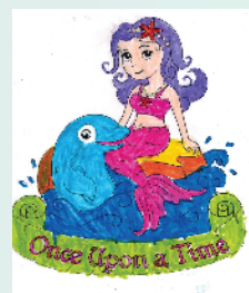
小记者:田家硕 编号:200968 周口七一路二小一(6)班