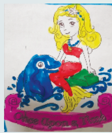
小记者:杨雅静 编号:200802 周口纺织路小学一(5)班