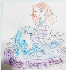
小记者:王茹 编号:200588 周口闫庄小学一(5)班