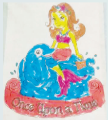
小记者:朱恩希 编号:200563 周口闫庄小学一(3)班