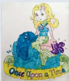
小记者:田亚东 编号:201888 周口李庄小学一(1)班