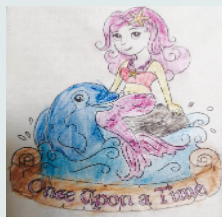
小记者:宋显含 编号:202727 周口六一路小学一(9)班