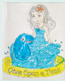
小记者:陈芃宇 编号:201915 周口李庄小学二(1)班