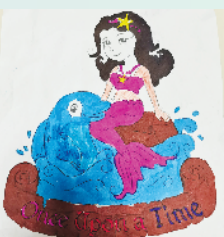
小记者:高梓萌 编号:201069 周口七一路二小一(4)班

亲爱的小记者,你是否常常想画一幅漂亮的画,却苦于无从下笔?本期开始,小记者填色游戏火热来袭,小伙伴们,快来填涂属于自己的“秘密花园”吧。