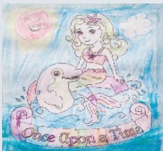
小记者:陈思霏 编号:201690 周口建设路实验学校三(3)班