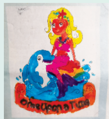
小记者:于悦 编号:200533 周口闫庄小学一(2)班