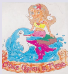
小记者:范宇豪 编号:200633 周口闫庄小学二(3)班