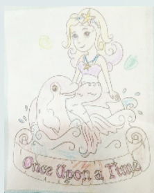
小记者:陈瑞阳 编号:201909 周口李庄小学二(1)班