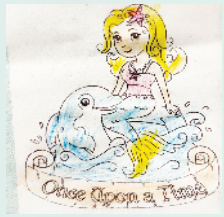
小记者:杜易泽 编号:200503 周口闫庄小学一(1)班