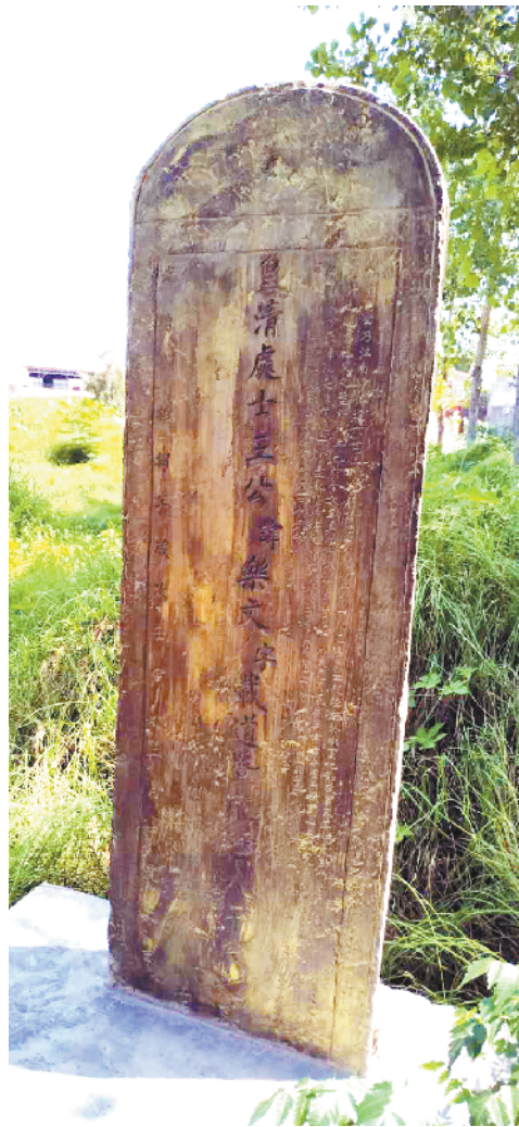
发现墓志铭的王氏祖茔地

王遵训（1629—1688），字子循，又字混庵，号信初，西华县奉母人，乃翰林院侍御王鼎镇的二儿子。他是清顺治十一年甲午科（1654年）举人，顺治十五年戊戌科（1658年）二甲第一名进士，选翰林院庶吉士，授监察御史。奉差巡视茶马，朝有增引之议，遵训力言其不可，奏罢之。除金都御史，历通政左参、太常卿，官至户部右侍郎。康熙二十六年（1687年）以“滥举”被免官。