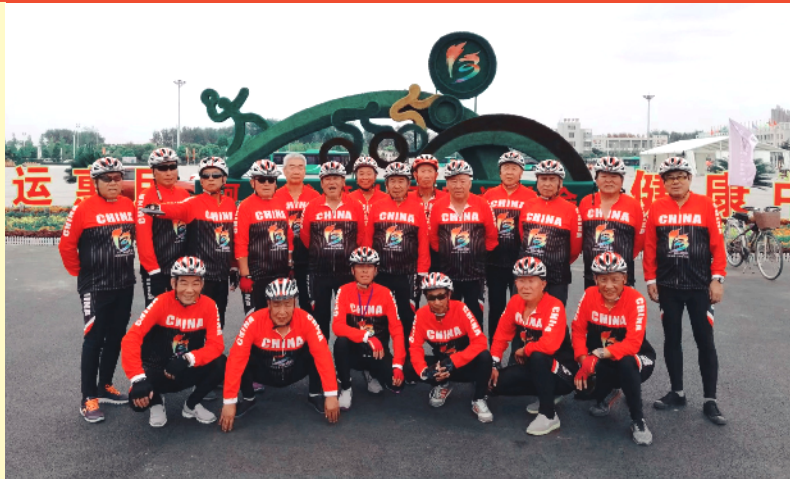
“马扎子”老年骑行队队员在市体育中心合影

七八年过去了,“马扎子”老年骑行队从最初的四五名队员逐渐增加到现在的40多人。老年骑行队里,年龄最大的队员已73岁,年龄最小的也有66岁了。时间的指针不