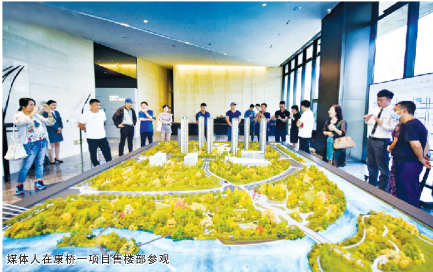
媒体人在康桥一项目售楼部参观