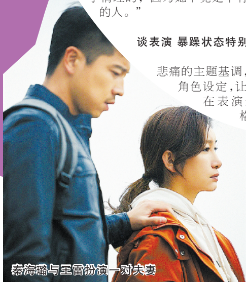
秦海璐与王雷饰演一对夫妻