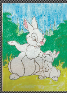
小记者:张可欣 编号:200517 周口闫庄小学二(1)班