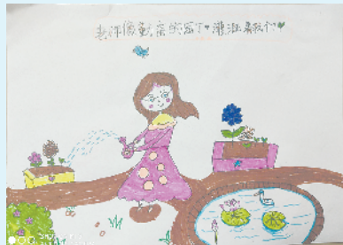
小记者:杨诗韵 编号:201705 周口经济开发区实验学校二(1)班