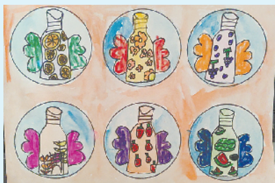
小记者:朱怡瑾凯 编号:201776 周口经开区实验学校一(4)班