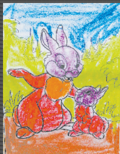
小记者:袁一博 编号:200601 周口闫庄小学二(4)班