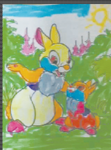
小记者:李艾轩 编号:200552 周口闫庄小学二(2)班