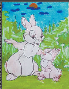
小记者:冯祺甜 编号:200686 周口闫庄小学四(3)班