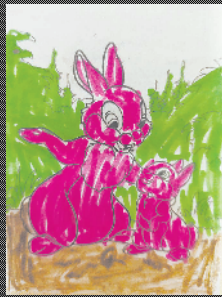
小记者:王佑麟 编号:200663 周口闫庄小学三(3)班