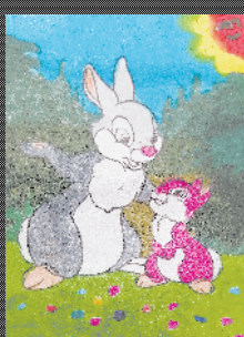
小记者:高歌 编号:200513 周口闫庄小学二(4)班