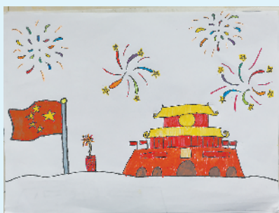
小记者:许博翔 编号:200027 周口七一路二小二(3)班