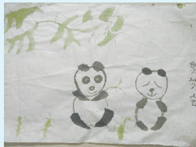
小记者:贾梦含 编号:191745 周口经开区一小三(2)班

本栏目刊发小记者的书法、绘画、摄影等作品。小记者们如果有这些爱好,快快行动起来吧!作品完成后,请用相机拍下来并发送到 zkwbxjz@126.com。