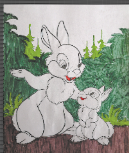
小记者:张开伦 编号:200011 周口七一路一小三(5)班