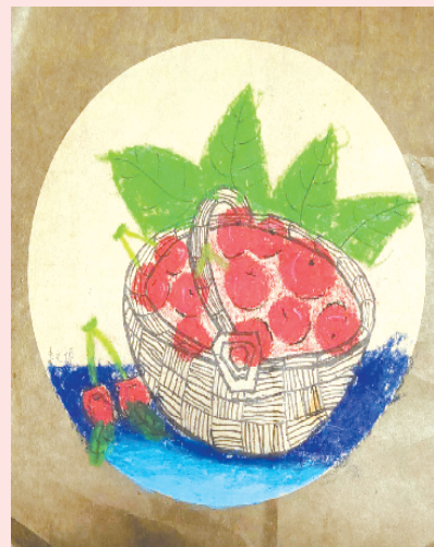
小记者:李文博 编号:205078 西华县昆山学校二(3)班

本栏目刊发小记者的书法、绘画、摄影等作品。小记者们如果有这些爱好,快快行动起来吧!作品完成后,请用相机拍下并发送到 zkwbxjz@126.com。