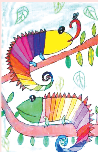
小记者:罗晨溪 编号:202960 沈丘县西关小学一(3)班