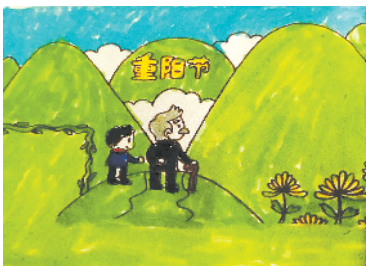
小记者:刘汉卿 编号:201889 周口李庄小学二(1)班