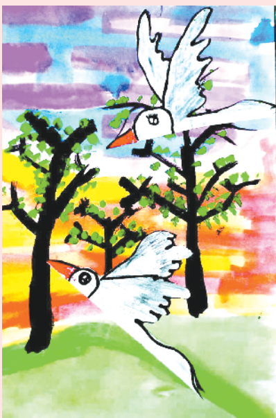
小记者:杨程铭 编号:202851 沈丘县西关小学一(1)班