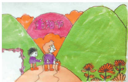
小记者:顾嘉悦 编号:201891 周口李庄小学二(1)班