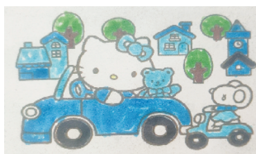
小记者:苑晨皓 编号:201937 周口李庄小学三(4)班