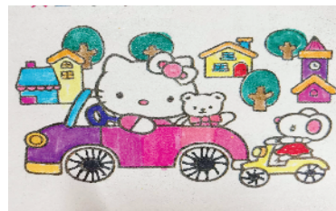
小记者:袁伊诺 编号:202666 周口六一路小学二(4)班