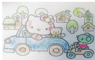
小记者:李才俊 编号:201936 周口李庄小学三(4)班