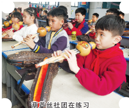
葫芦丝社团在练习