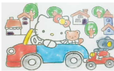
小记者:韩雨辰 编号:201900 周口李庄小学二(2)班