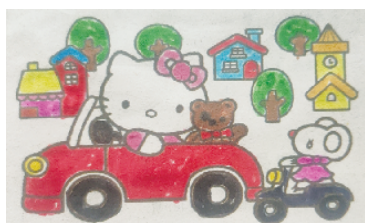
小记者:苑如萱 编号:201907 周口李庄小学二(4)班