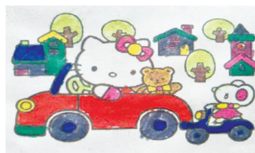
小记者:李希灿 编号:201886 周口李庄小学二(1)班