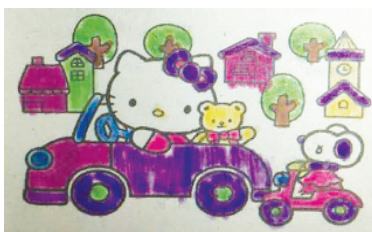
小记者:胡依萌 编号:201885 周口李庄小学二(1)班