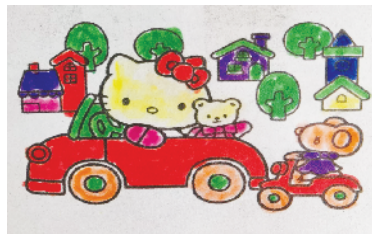
小记者:刘熙雯 编号:200508 周口闫庄小学二(1)班