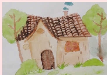
小记者:盖毓鑫 编号:20103 周口七一路二小二(3)班