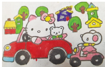
小记者:范宇豪 编号:200633 周口闫庄小学三(1)班