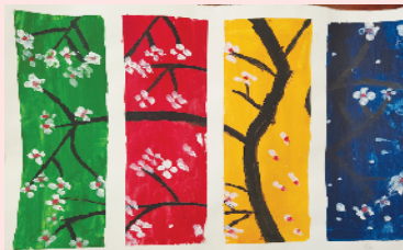
小记者:杨诗韵 编号:2007005 周口红开区实验学校二(1)班

本栏目刊发小记者的书法、绘画、摄影等作品。小记者们如果有这些爱好,快快行动起来吧!作品完成后,请用相机拍下并发送到zkwbxjz@126.com。