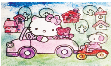
小记者:王茹 编号:200588 周口闫庄小学二(5)班