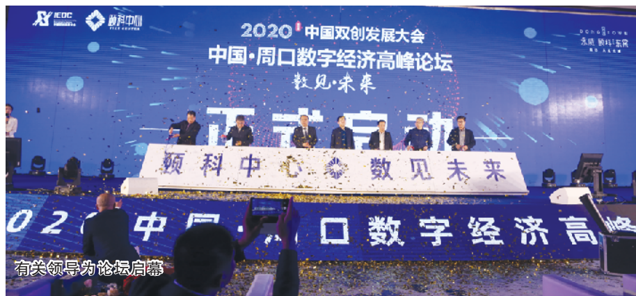
□记者 李国阁 曹丹 文/图

本报讯 数融万物，智享未来。11月8日，由周口市工商联、市城乡一体化示范区指导举办，河南省浙江商会、浙江颐高新经济科技发展有限公司、周口市颐霖置业有限公司联合承办的中国·周口数字经济高峰论坛在弗斯特会议中心成功举行。